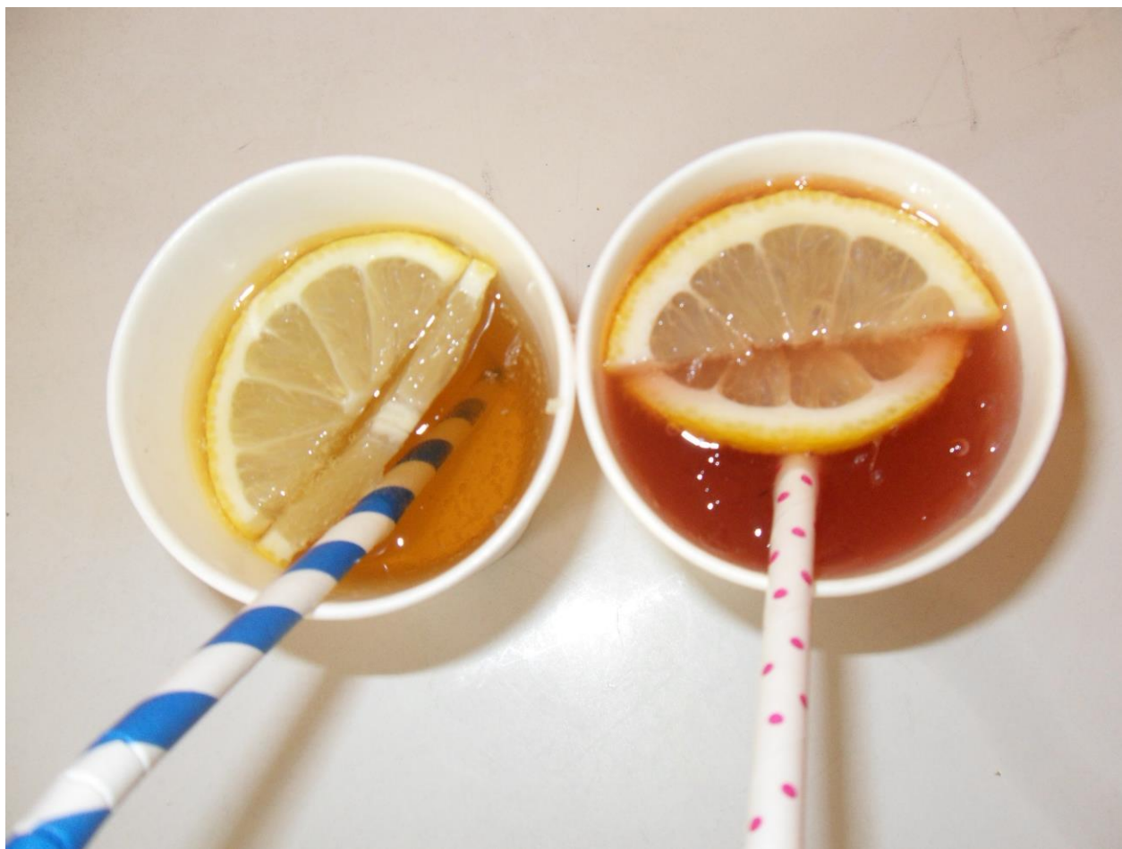
links der Grüne Wicht, rechts der Unicorn Tears.

Steht die Kinderstadt vielleicht wirklich vor einem Systemwechsel? Und wenn ja, was ist die Alternative zu einem Bürgermeister? Eine spannende Frage. Wir halten euch auf dem Laufenden.