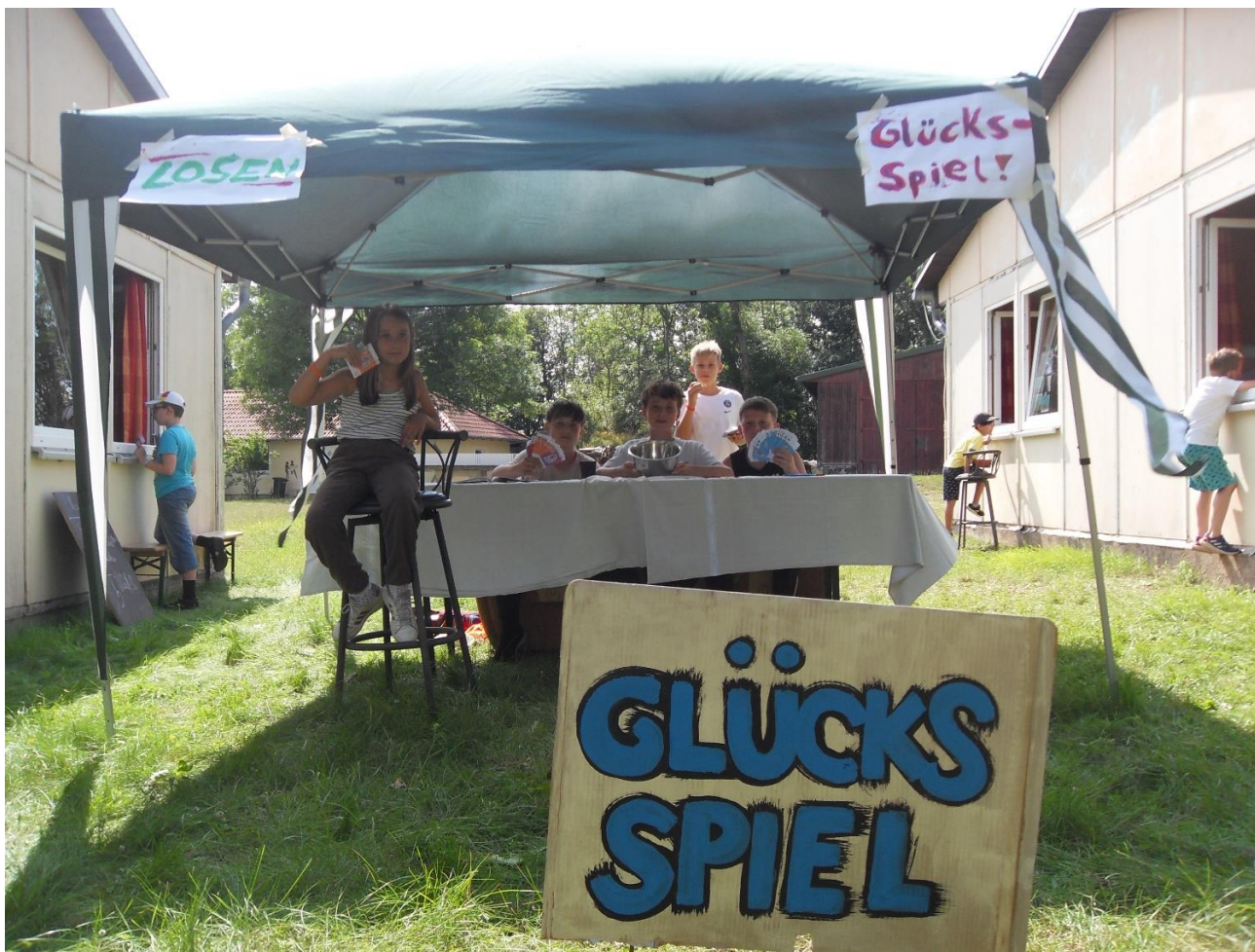
Die Los-Lotterie verkauft seit gestern Lose mit Gewinnchancen.