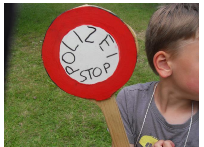
Die Polizei stoppte mehrere Verdächtige

Doch die Polizei ließ sich nicht abschütteln. Immer wieder kam es im Laufe des Tages zu Begegnungen, aber die Beweise fehlten. Als die Polizei den Verdächtigten dann mit völlig unangemessener Härte festnahm, musste zudem festgestellt werden, dass sie die ganze Zeit über an einem unschuldigen Bürger dran waren. Deshalb fordern wir, dass die Polizeistelle neu besetzt wird, so ist die Kinderstadt einfach nicht sicher. Wir brauchen neues und vor allem qualifiziertes und faires Personal.